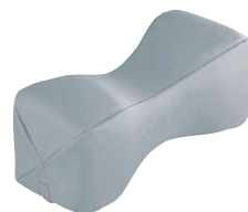
COUSSIN DE NUQUE