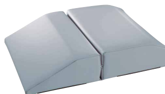
COUSSIN CALE JAMBE