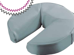
COUSSINS DE VISAGE