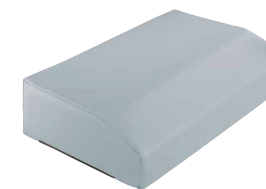
COUSSIN APPUI TIBIA